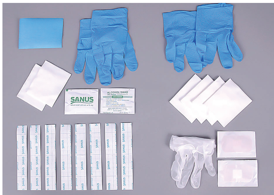
slika 1: Fistula set