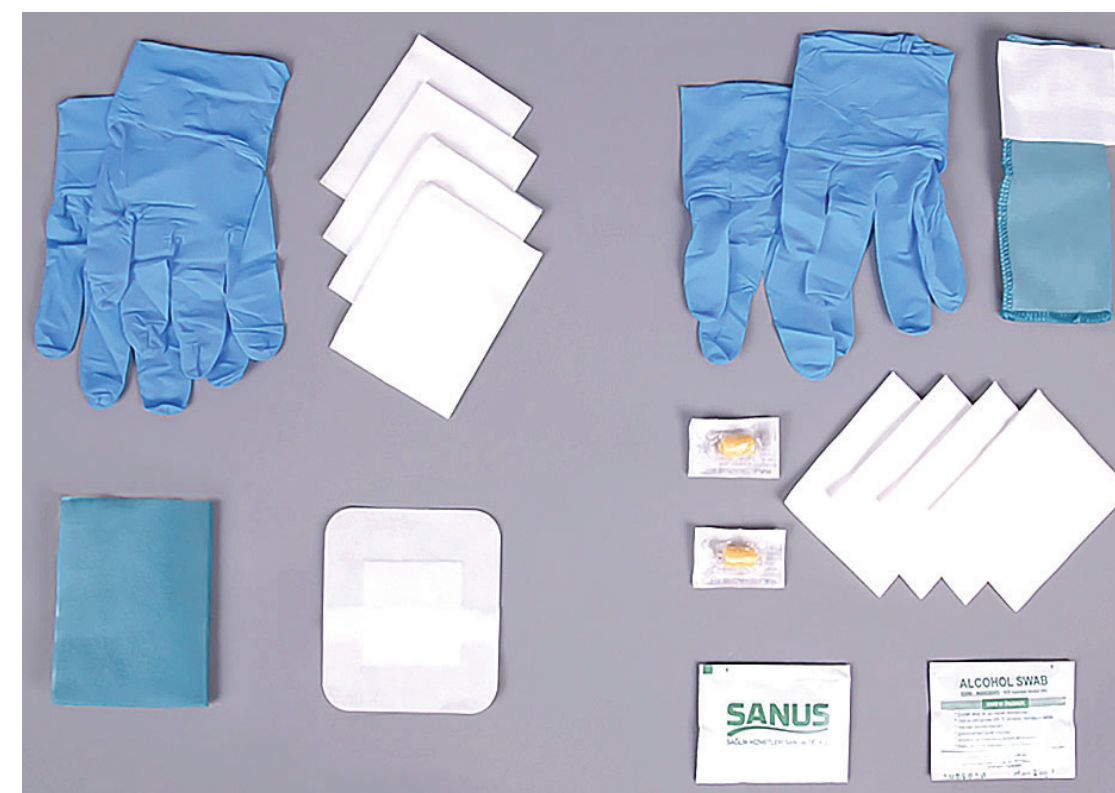
slika 2: Catheter set